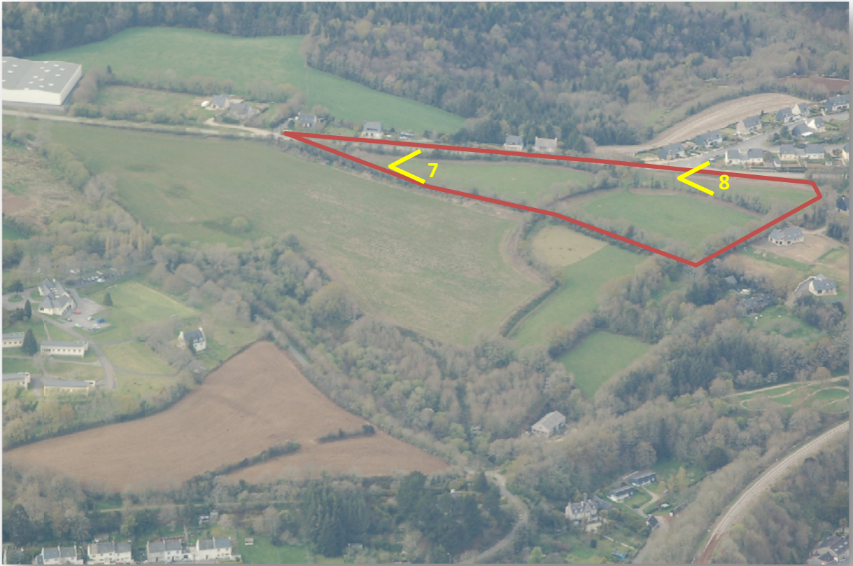
7 : Vue sur l'Ouest du terrain